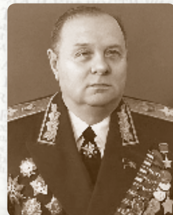
К. А. Мерецков

Тогда же звание почётного гражданина было присвоено Петру Кирилловичу Кошевому (1904–1976). В Тихвине его именем назван проезд. В середине ноября 1941 г. части 65-й стрелковой дивизии под командованием полковника Кошевого были переброшены из-под Москвы в район деревни Астрачи. Дивизия держала оборону Астрачинского рубежа.